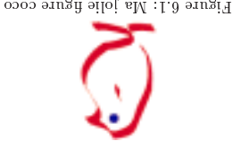
Figure 6.1 : Ma jolie figure coco

\documentclass[11pt]{report} \usepackage{graphics}